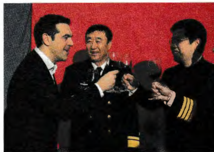
Griekse premier toast met Chinezen in Piraeus