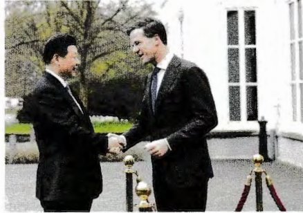
Premier Rutte verwelkomt president Xi Jinping