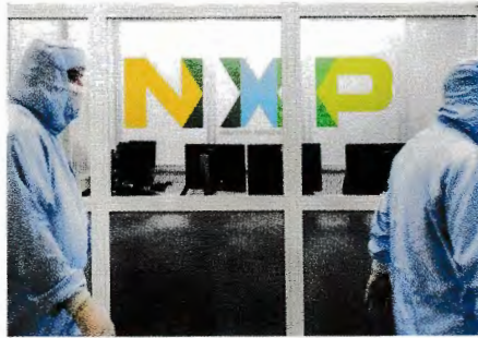
Nijmeegse chipmaker NXP in Chinese handen

2016 ChemChina en Guoxin kopen voor 925 miljoen euro spuitgieterij KraussMaffei.