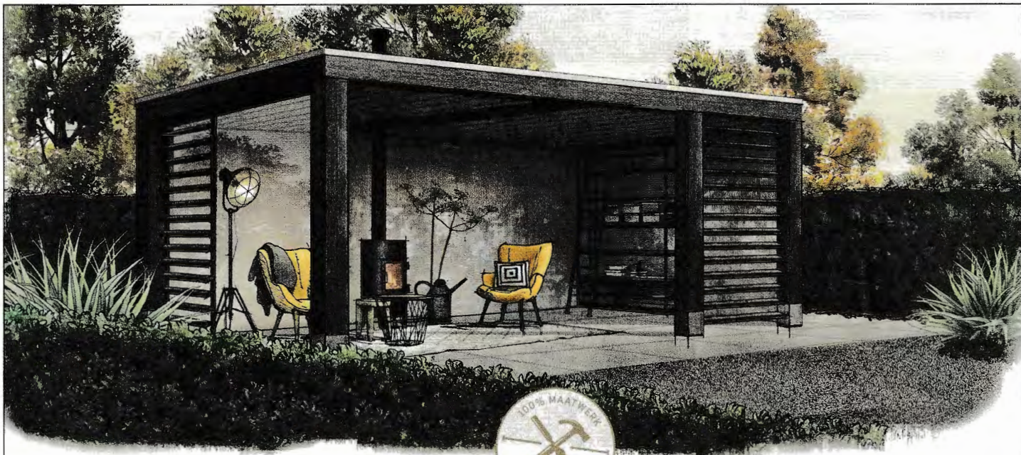
Gaev 203, vanaf 16.900 (o.b.v. 6 x 3,5 meter)